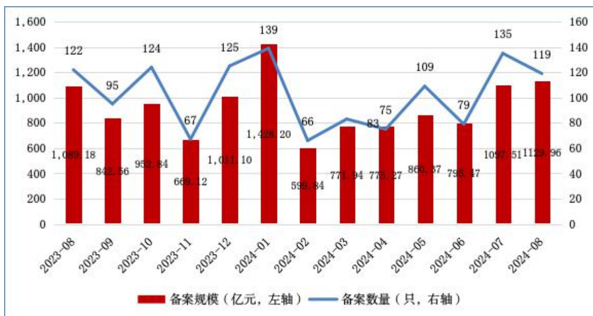
图1 ABS月度备案数量及规模情况

2024年8月，资产支持专项计划 [1] （以下简称ABS）新增备案119只，新增备案规模合计1,129.96亿元（见图1）。其中基础设施公募REITs所投ABS [2] 备案1只、19.74亿元。此外，新增备案规模前三的ABS基础资产分别为：小额贷款债权、融资租赁债权、应收账款，备案规模分别为314.36亿元、235.51亿元、223.91亿元（见表1）。