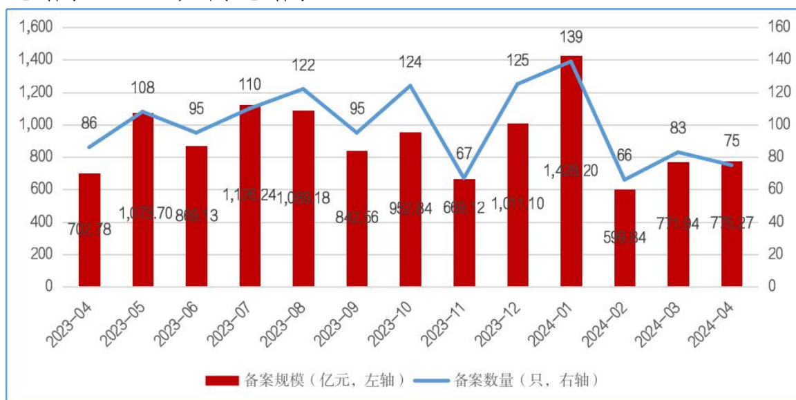
图1 ABS产品每月备案规模及数量变化趋势

2024年4月，企业资产证券化产品共备案确认75只，新增备案规模合计775.27亿元（见图1）。4月新增备案规模环比增长0.43%，同比增长10%。